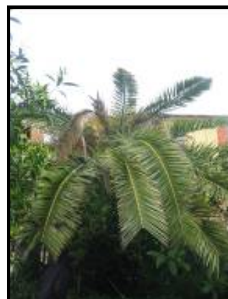
Fig. 4 Asimmetria della chioma e appiattimento

L'esito finale dell'infestazione di Rhynchophorus ferrugineus sui vegetali di palma è la morte della pianta, la cui chioma presenta tutte le foglie secche e ripiegate verso il basso, in una tipica forma ad ombrello.