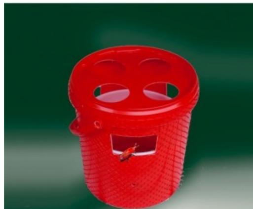
Fig. 1. Trappola a feromoni