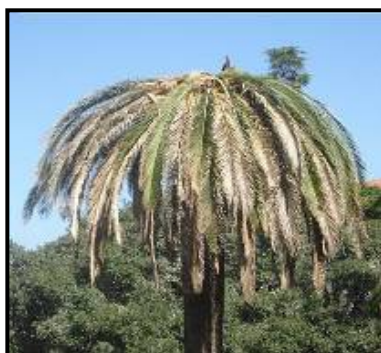
Fig. 5 Disseccamento generalizzato e appiattimento

L'esito finale dell'infestazione di Rhynchophorus ferrugineus sui vegetali di palma è la morte della pianta, la cui chioma presenta tutte le foglie secche e ripiegate verso il basso, in una tipica forma ad ombrello.