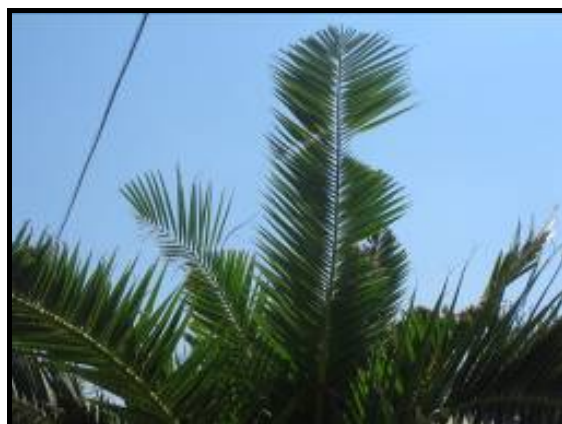
Fig. 3 Margini seghettati e rosure fogliari

Successivamente si ha un gradiente di danno sempre più intenso con la cima che si piega e la chioma che si appiattisce. La pianta, da un'osservazione a distanza, appare come appiattita.